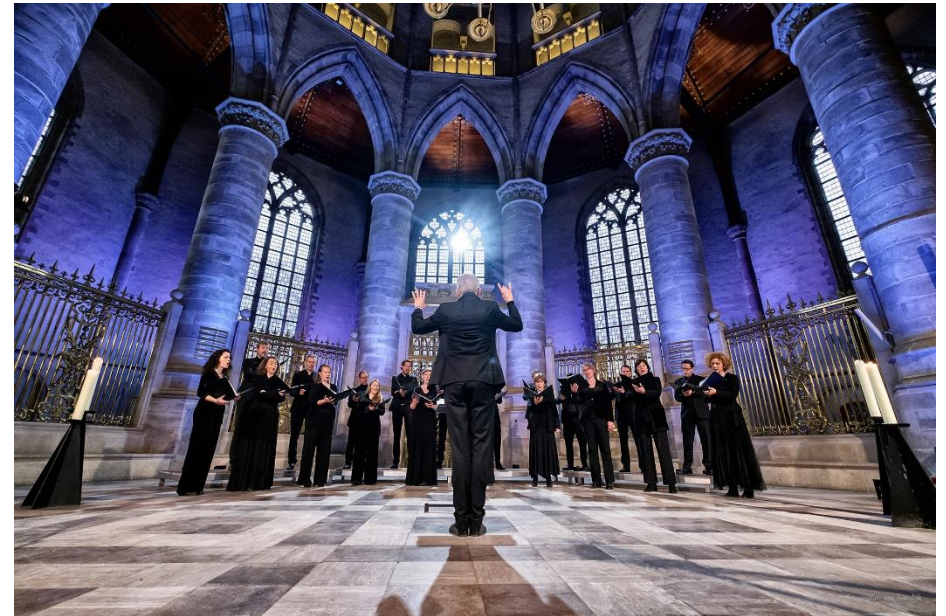
Laurens Collegium Rotterdam